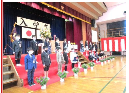
一人ひとりを紹介